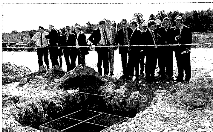
Visite de chantier guidée par les trois associés de Polytech.

Le bâtiment de Polytech sera raccordé au réseau de chaleur de la zone de la Montane que gère la société Cofely. Le SYMA a investi près de 60 000 € pour réaliser ce raccordement.