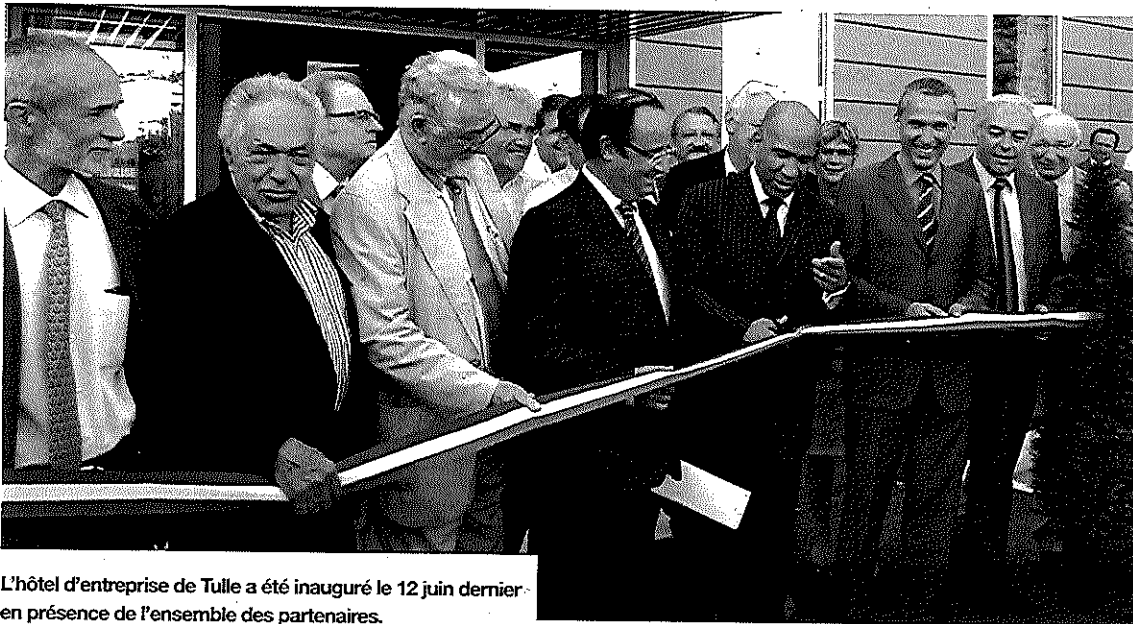
L'hôtel d'entreprise de Tulle a été inauguré le 12 juin dernier en présence de l'ensemble des partenaires.

Pour palier au manque de surfaces de bureaux alliant qualité et coût adaptés, dynamiser l'économie du Pays de Tulle et permettre aux entreprises de s'installer durablement sur le territoire un hôtel d'entreprises vient d'être construit sur l'ancien site du GIAT, dans le cadre du contrat de site de Tulle. Cet hôtel d'entreprise peut accueillir des porteurs de projets ainsi que des entreprises existantes, souhaitant s'implanter de façon temporaire ou définitive sur Tulle dans des conditions optimales de confort et de sécurité pour faire pousser leur jeune entreprise. "Il en va de la vie d'une entreprise comme de celle d'un enfant, elle a besoin d'être accueillie, héber-