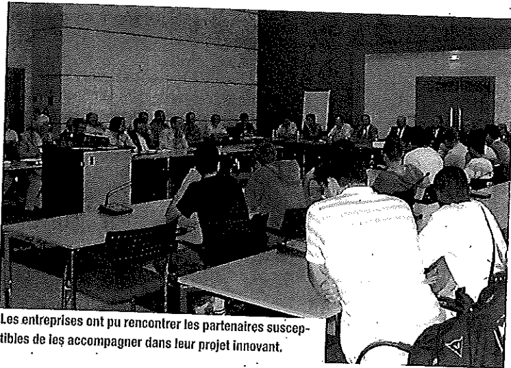
Les entreprises ont pu rencontrer les partenaires susceptibles de les accompagner dans leur projet innovant.

Les Chambres de Commerce et d'Industrie du Limousin, soutenues par le Conseil régional, ont organisé récemment la troisième édition des rencontres de "la route de l'innovation" successivement à la CCI du Pays de Brive et à la CCI de Guéret.